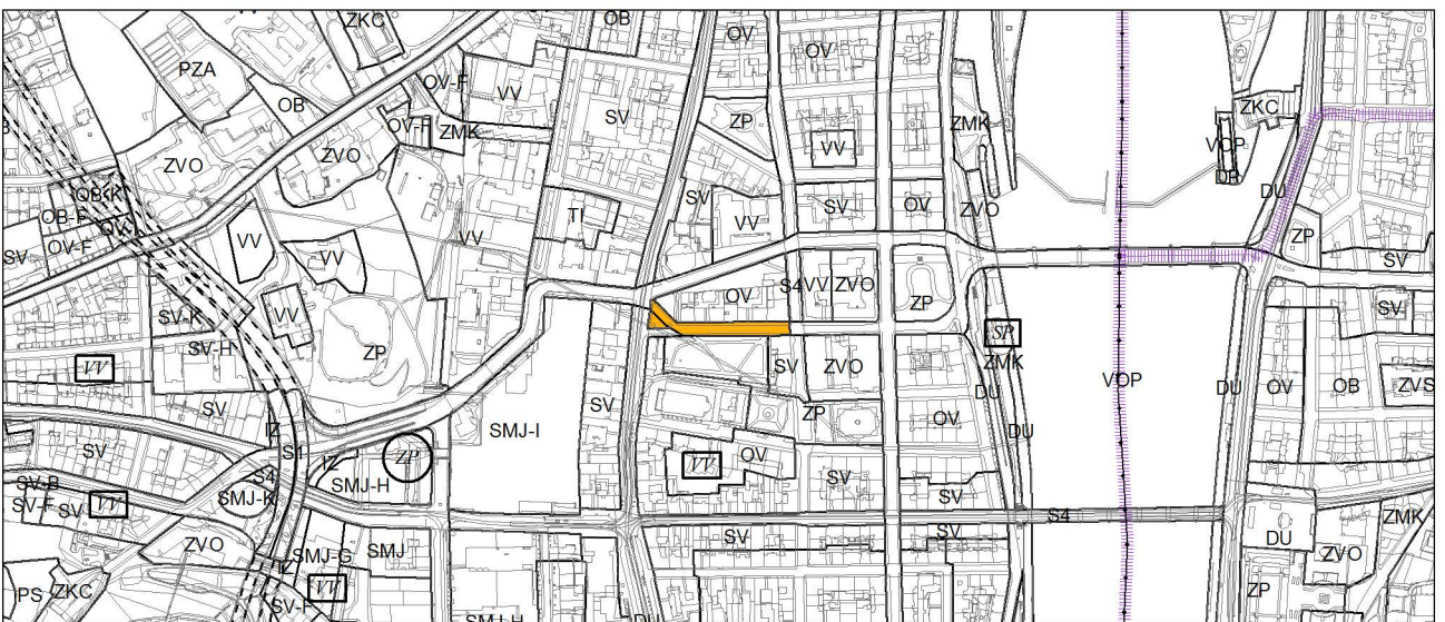
Základní zadání změny schválený usnesením ZHMP č. 25/24 ze dne 30. 3. 2017